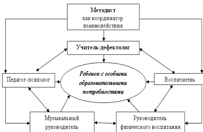
Система взаимодействия логопеда и воспитателя по созданию условий для исправления и компенсации речевой патологии.